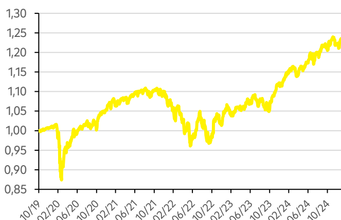
Vývoj hodnoty fondu Strategy 30